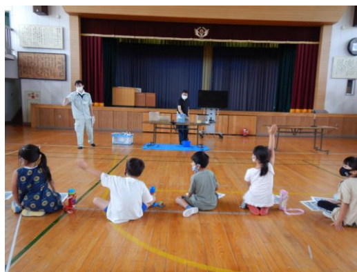
▲ 生き物当てクイズの様子