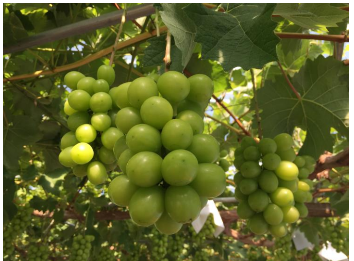
▲ 生育中の「シャインマスカット」