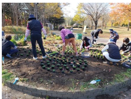
◀ 花壇の植え替え作業の様子

これからも、花と緑の普及活動を通じて、豊かなまちづくりの一端を担っていただくとともに、2つの表彰を契機に、ますます元気な会の活動が期待されます。