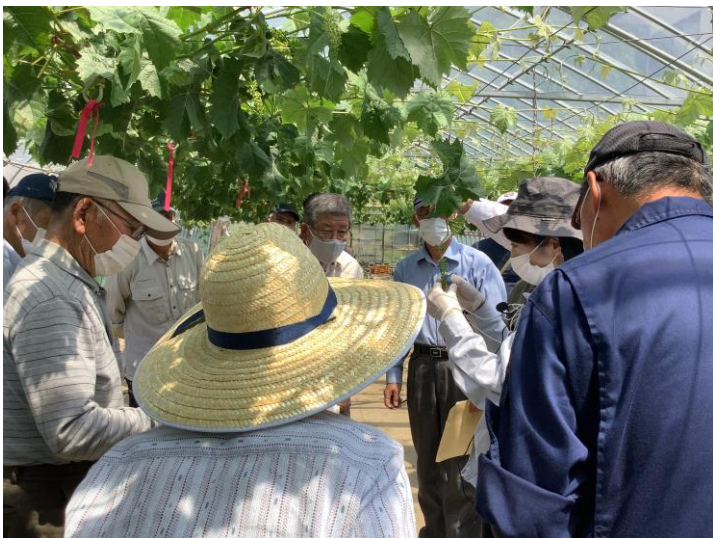
▲ 房づくり作業の説明の様子

「シャインマスカット」は順調に生育しており、収穫は 9 月下旬からの見込です。10 月には JA 新みやぎ元気くん市場仙台南店（太白区茂庭）で販売会を予定しておりますので、皆様の御来店をお待ちしております。