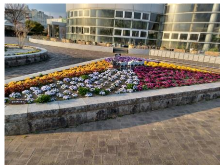
七北田公園の花壇 ▶