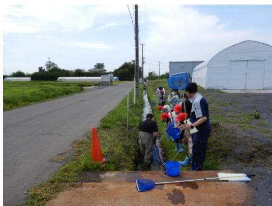
▲ 生き物調査の様子

児童からは、「たくさんの生き物を捕まえることができて楽しかった！」「学校の近くにザリガニがこんなにたくさんいたのは知らなかった！」といった元気な言葉をいただきました。