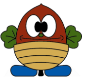
どんぐり松ちゃん