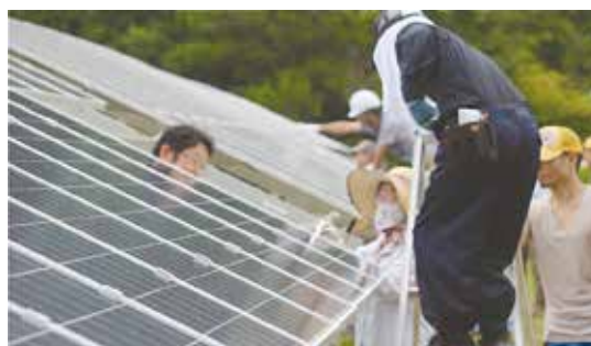
太陽光パネル設置の様子

ひっぼ電力株式会社では、更に地域の資源を有効に活用したいと、豊富な沢水と勾配のある地形を生かした水力発電の実証試験に取り組んでおり、将来的には筆甫地区の各家庭にも設置できるような小型の独立電源としての実用を目指しています。