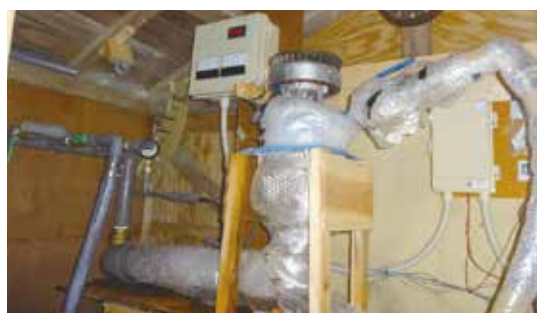
実証用水力発電機