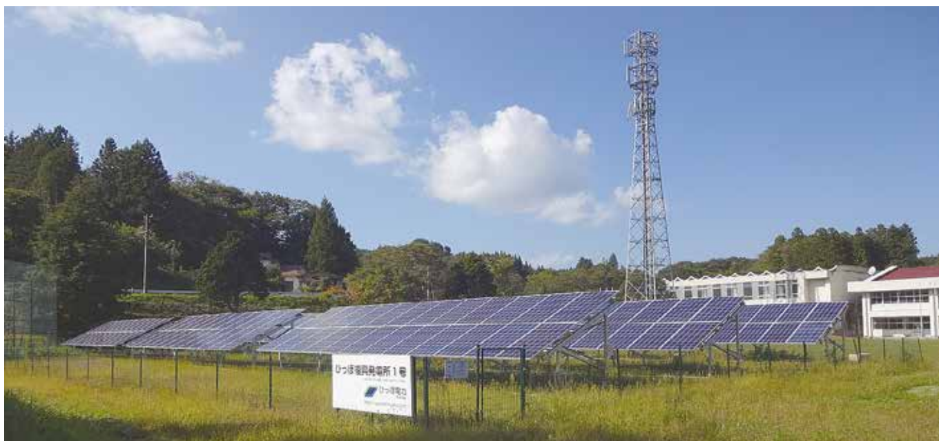
ひっぼ復興発電所 1号

丸森町のひっぼ電力株式会社は、地域の住民と協働しながら再生可能エネルギーの導入を進め、地域の活性化に取り組んでいます。