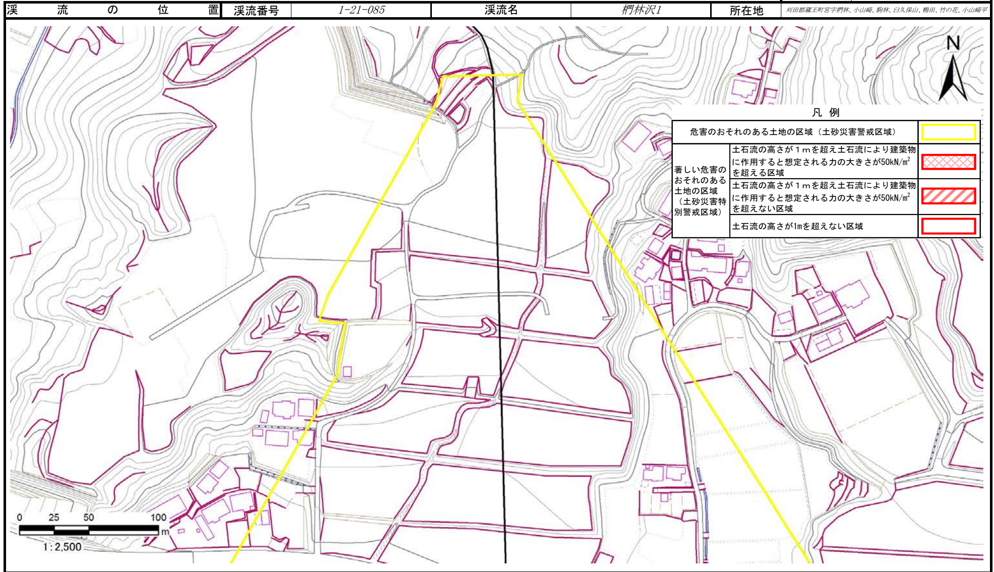
危害のおそれのある土地、著しい危害のおそれのある土地の設定図