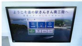
情報提供モニター