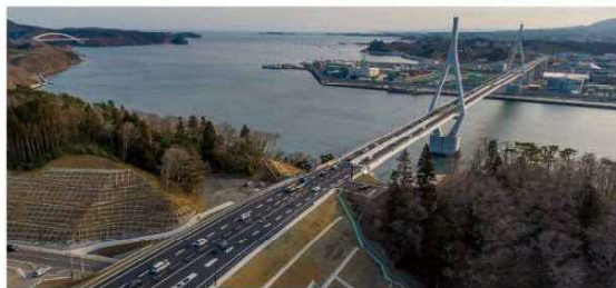
三陸沿岸道路(気仙沼港IC～唐桑半島IC)令和3年3月 開通