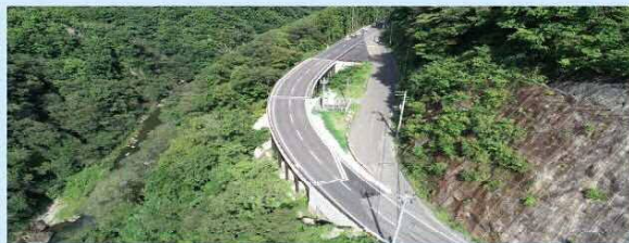
部分供用開始区間

(国)113号は新潟県新潟市を起点とし、山形県や宮城県の間南を経て福島県相馬市を結び、県境や郡界を越えた地域間連携強化などに資する重要な道路です。また、宮城県内においては緊急輸送道路に指定されており、災害発生時には避難路や物資輸送路などの役割を担っています。しかし、(国)113号の福岡蔵本地区については、地形が急峻で幅員狭小・線形不良の隘路区間となっていることから、安全で円滑な交通を確保するため平成25年度から道路整備を推進しています。福岡蔵本工区の実績によって、県南地域における広域連携の強化が図られるとともに、地域の安全安心の向上が期待されています。