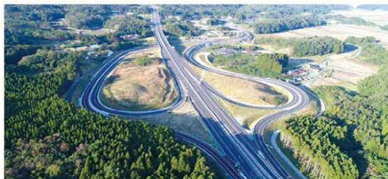
山元南スマートIC 平成29年4月 開通