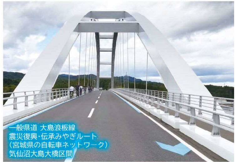
一般県道 大島浪板線 震災復興・伝承みやぎルート (宮城県の自転車ネットワーク) 気仙沼大島大橋区間