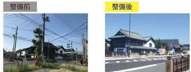
[(都)並柳福浦線(大崎市)]