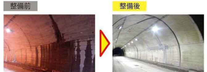
漏水対策の実施 [(国)113号 小原4号トンネル(白石市)]