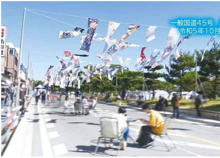
一般国道45号 松島町交通社会実験 令和5年10月14日・15日実施