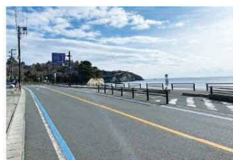
自転車走行環境の整備 [(主)塩釜七ヶ浜多賀城線(七ヶ浜町)]