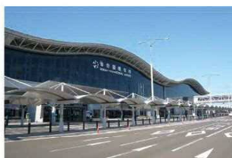
仙台空港(名取市・岩沼市)