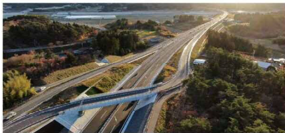
三陸沿岸道路(小泉海岸IC～本吉津谷IC)令和2年11月 開通

三陸沿岸道路の開通により、災害時にも緊急輸送路として機能する信頼性の高い高速ネットワークが形成されるとともに、地域経済の活性化や観光振興など、東日本大震災からの復興に大きく貢献しています。