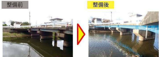
橋梁の補修 [(一)新田若柳線 沼口橋(登米市)]

橋梁やトンネルなどの道路施設について、個別に策定している長寿命化計画に基づき、引き続き計画的に予防保全型の修繕を推進します。