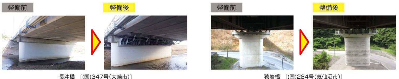
整備前 整備後 長沖橋 [(国)347号(大崎市)]

緊急輸送道路といった重要道路の安全確保や避難路確保のため、引き続き、「宮城県橋梁耐震化計画」に基づき橋梁耐震化を推進します。特に、阪神淡路大震災以前の基準で整備された緊急輸送道路における橋梁を中心に耐震化を推進します。