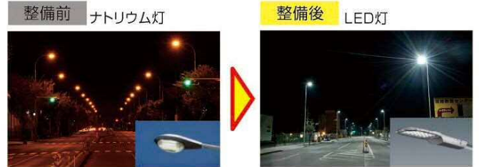
道路照明灯LED化の実施