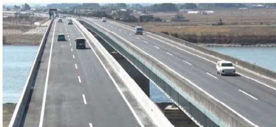
常磐自動車道(山元IC～岩沼IC)令和3年3月 4車線化

また、高速道路利用者の利便性向上を目的に、スマートICの整備も進められており、平成27年度には鳥の海スマートIC、平成29年度には山元南スマートIC等が開通しています。