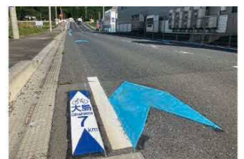
自転車走行環境の整備 [(一)大島浪板線(気仙沼市)]