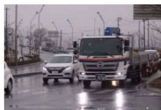
空港周辺の混雑状況 [(主)仙台空港線 下野郷(岩沼市)]