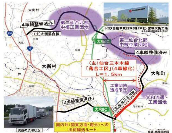
(主)仙台三本木線(落合)