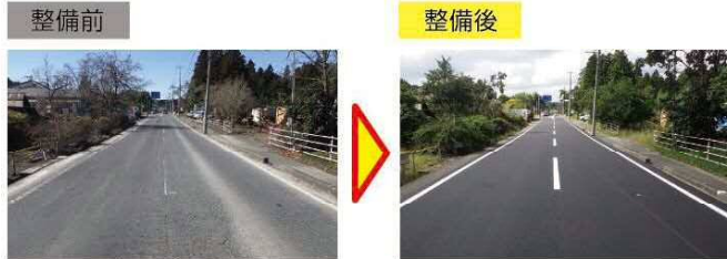
舗装補修 [(国)457号(大和町)]

安全で円滑な交通を確保するため、舗装補修や除草・清掃などの環境整備、除融雪などの適切な維持管理を推進します。また、道路照明灯について、消費電力の少ないLED灯に更新し、温室効果ガスの排出削減やコストを縮減します。