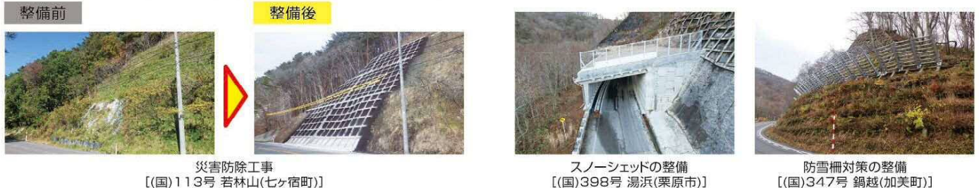
整備前 整備後 災害防除工事 [(国)113号 若林山(七ヶ宿町)]