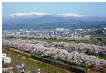
一目千本桜・船岡城址公園 (大河原町・柴田町)