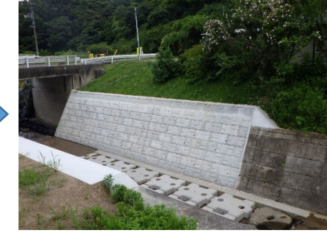
丸森町 古田峠線 18345号