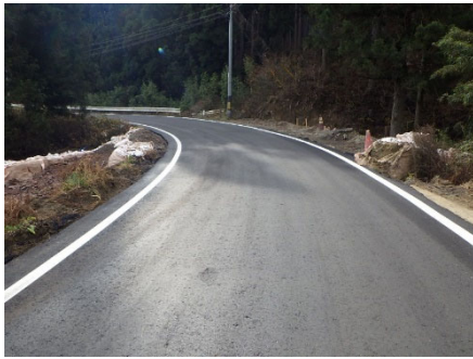
丸森町 古田峠線 18340号