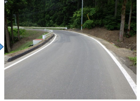
丸森町 古田峠線 18344号