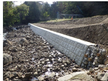
白石市 天津沢川 190号