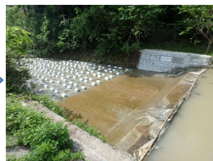
角田市 (一)越河角田線 651号