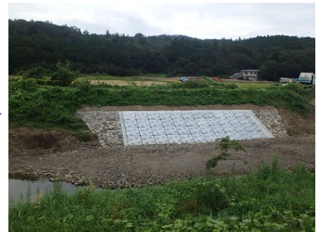
白石市 沢の内川 180号