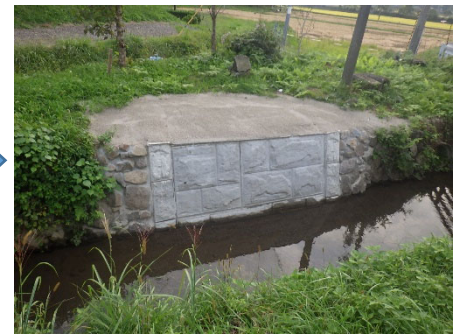
白石市 高田川 200号