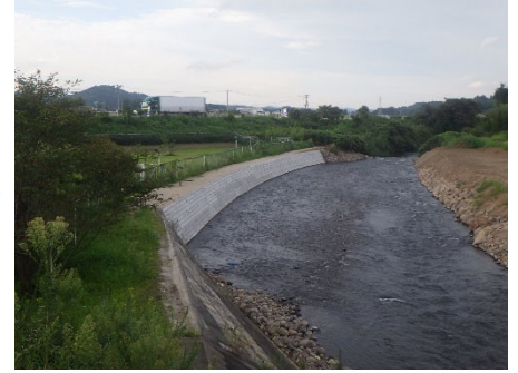
村田町 荒川 133号