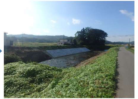
白石市 齋川 170号