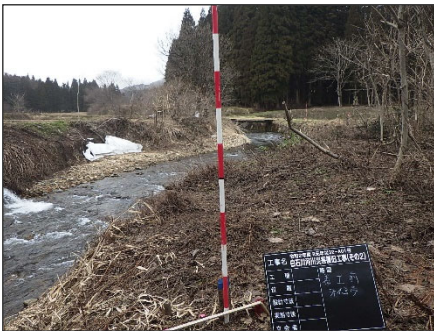
七ヶ宿町 白石川 43号