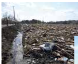
農地の浸水(七ヶ浜町)