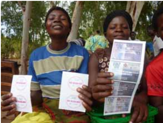
写真3：配布後の状況

ているようであった。受益者の選定方法などについて、農業省と農家に聞き取りを行ったが不明確であった。