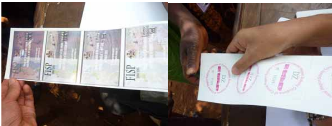
写真1, 2 表面と裏面。上からNPK, 尿素, メイズ, その他豆類となっている

このプログラムは、小規模農家向けの化学肥料・種子補助金プログラムであり、農業・食料安全保障省が2005年度から導入している。受益者として選定された農家は農業普及所で『クーポン』を受け取り、化学肥料・種子を低価格で購入できる。クーポンは、化学肥料がNPK(窒素・リン・カリウム)と尿素の各一枚、それから、主食であるメイズ種子(10kg)とその他豆類(落花生)の計4枚綴りになっている。特に化学肥料の割引率が高く、通常で価格5,000MK(マラウイクワチャ)のものが500MKで購入できる。種子も市場価格の5割以上値引きされる。