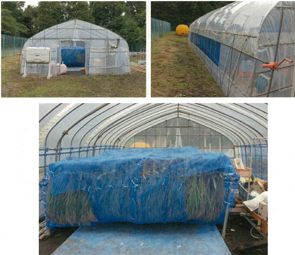
隔離圃場内にあるビニールハウス内の組換えイネの乾燥の様子（平成24年10月3日撮影）