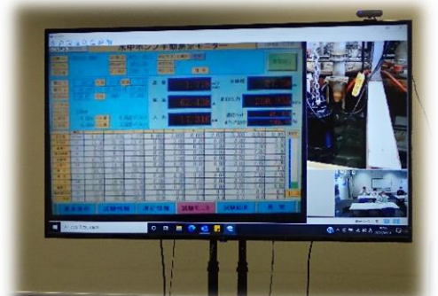
▲ポンプの性能確認画面