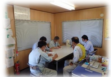
▲工事関連資料の確認