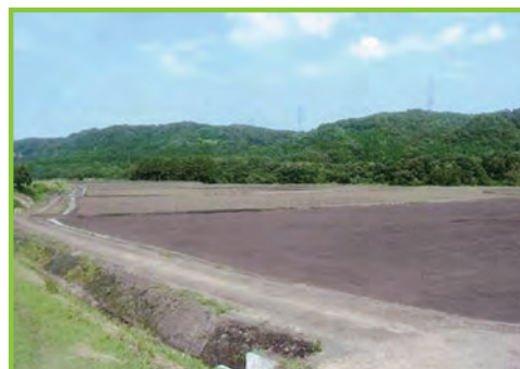
中山間地域総合整備事業 南鹿原地区

農業の生産条件等が不利な中山間地域において、農業生産基盤の整備と併せて、農村生活環境基盤等の整備を総合的に実施することによって、中山間地域における農業農村の活性化を図るとともに国土・環境の保全等を図ります。