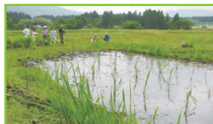
中山間地域等 直接支払制度 大尺集落

中山間地域等における多面的機能の維持・増進を図るため、自律的かつ継続的な農業生産活動等の体制整備に向けた前向きな取り組みを支援します。