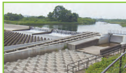
基幹水利施設 管理事業 三丁目頭首工

国営土地改良事業で造成された基幹的な農業水利施設について適正な維持管理を行います。