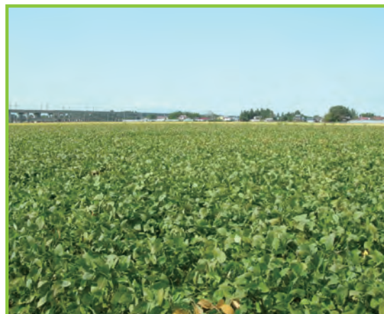
経営体育成基盤整備事業 敷玉西部地区

水田の区画整理工事を中心に用排水路・道路・暗渠排水・客土等総合的な整備を行い、大型機械の導入による労働生産性の向上を図るとともに農地の汎用化を推進します。