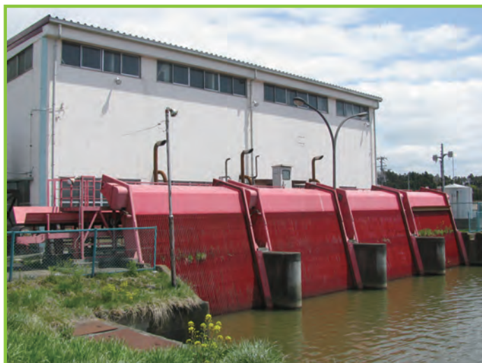
基幹水利施設ストックマネジメント事業 田尻排水機場

ダム・頭首工・用排水機場・幹線用排水路等、基幹的な農業用排水施設の整備を行い、用水不足の解消や水害防止をはじめとした水利用の安定と合理化により、農業生産性の安定を図るものです。