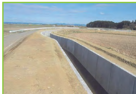
県営ため池等整備事業 宝江地区

自然的社会的状況の変化で脆弱化している農業用施設で、豪雨・地震等で被災した場合、周囲の農地・施設・人家等に被害を与えるおそれがあるものについて、被害を未然に防止するため、施設の整備・補強を行います。