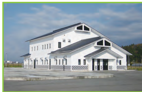
農業集落排水事業 一栗地区

都市に比べて立ち遅れている農村の生活環境の整備と、これと密接な関連のある農業生産基盤の整備を一体的・総合的に行うもので、農業集落排水施設の整備をはじめ、集落道路・集落排水路・農村公園・営農飲雑用水施設・農道・農業排水路等を整備します。