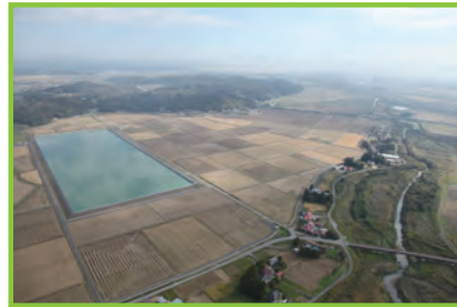
農村災害対策 整備事業 沖富地区

甚大な災害を受けた地域において、再度の災害発生を防止するための農業用施設等の整備に併せて、持続的な営農が行われ農業用施設等の洪水防止等の防災機能を十分発揮させるために、農業生産基盤の整備と農村生活維持施設の整備を行います。