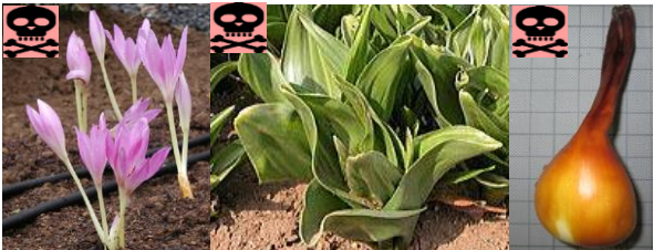
イヌサフラン(左から花・葉・球根)