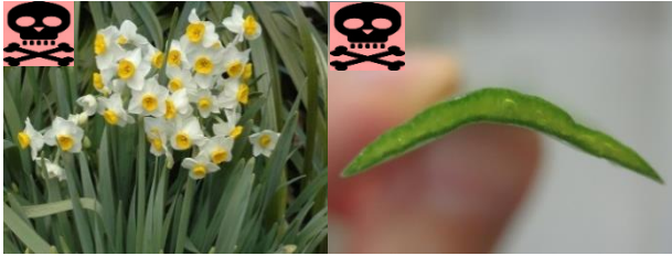
スイセン（花と葉） スイセン（葉の断面）