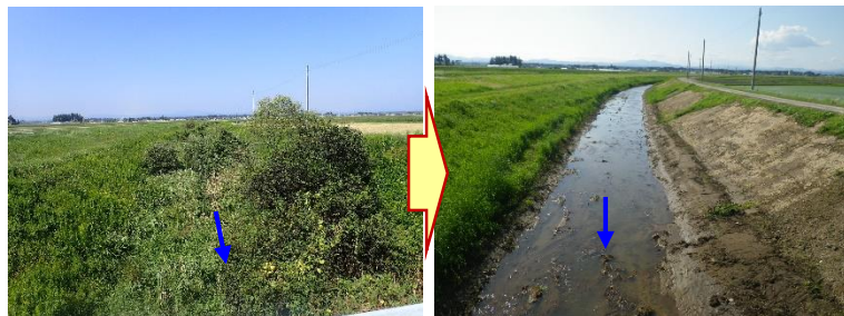
堆積土砂及び支障木の撤去状況(令和2年度施工) ＜一級河川鳴瀬川水系渋井川＞

今年度は、多田川や渋井川等の堆積土砂や支障木による河道の阻害状況が顕著な区間について、計画的に除去を行います。