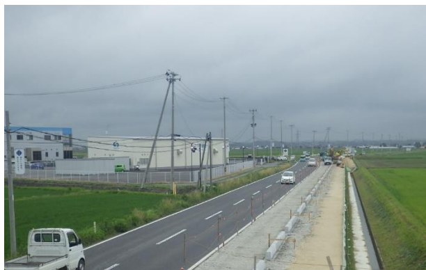
二郷工区の施工状況

工事は、鹿島台側から現道の北側に新たな歩道の整備する計画となっており、順次整備を行っております。工事の際には、片側規制等を行っておりますので通過の際にはご注意ください。