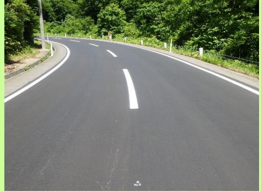
施工前 完了 国道347号 加美町漆沢地区（令和2年6月に補修が完了しました）