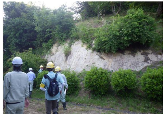
大崎市館崎地区の点検状況

お問い合わせ：河川砂防第1班 0229-91-0736, 河川砂防第2班 0229-91-0747