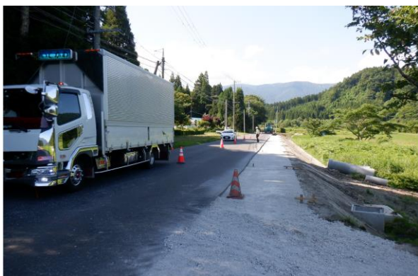
岡台工区の施工状況

国道108号は物流や観光振興等に重要な役割を担う幹線道路です。冬期は除雪により路肩に積み重なった雪で幅員が狭くなり、大型車のすれ違いが困難となることから、円滑な通行の確保に向け、幅員の拡幅を行っています。