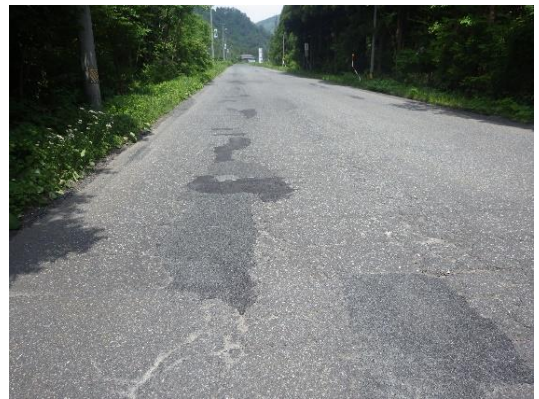
国道108号 大崎市鳴子温泉鬼首地区の路面状況