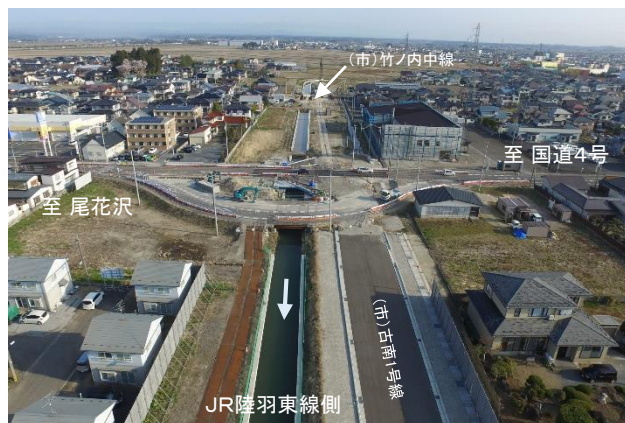
国道347号橋梁箇所の施工状況

今年度は、現大江川から新大江川に洪水を分水する施設に着手し、早期完成を目指します。