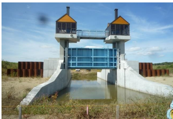
佐賀川水門の施工状況

田尻川の支川である佐賀川では、洪水時に江合川及び田尻川の背水位の影響を受けるため、沿川地域では度重なる洪水被害に遭ってきました。