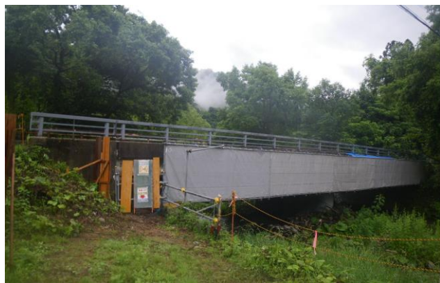
一般県道 沼倉鳴子線 仙北沢橋の施工状況

大規模地震発生時における救援・支援路の確保に向け、緊急輸送路や主要幹線道路等において橋梁の耐震化を推進するとともに、完成後長年経過した橋梁の老朽化対策として、橋梁補修を実施するなど、橋梁の機能強化等に努めております。