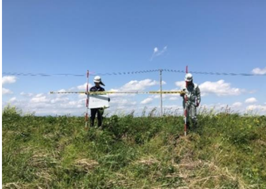
名蓋川の点検状況