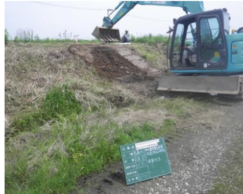
名蓋川の対策状況

お問い合わせ：河川砂防第1班 0229-91-0736, 河川砂防第2班 0229-91-0747