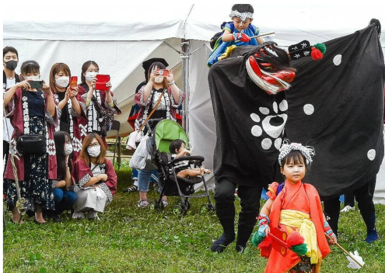
【第10回みやぎのふるさと農美里 のんびり フォトコンテスト(R4)】