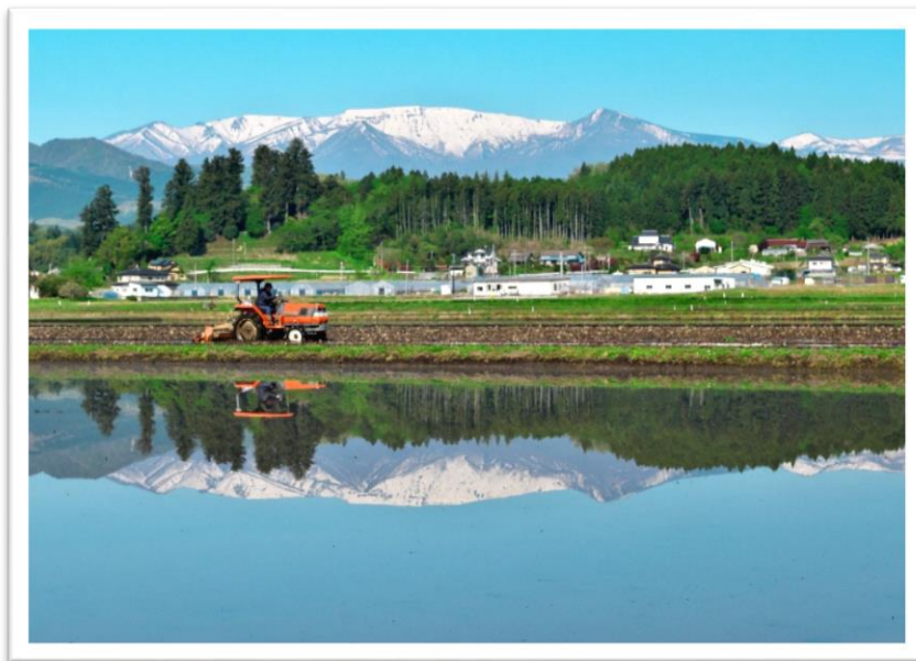
【第7回みやぎのふるさと農美里 のんびり フォトコンテスト(R1)】