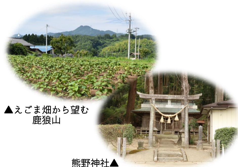
▲えごま畑から望む 鹿狼山