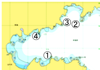
図 調査点(鮫ノ浦湾) ※④'は④よりも岸側