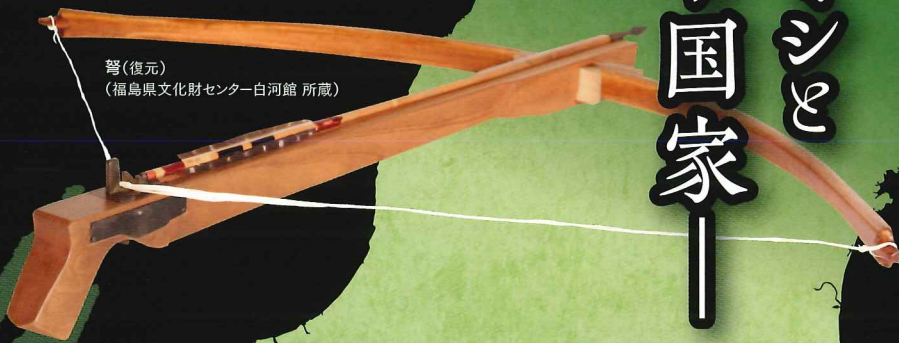
弩(復元) (福島県文化財センター白河館 所蔵)