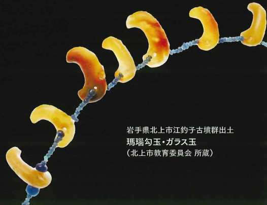
岩手県北上市江釣子古墳群出土 瑪瑙勾玉・ガラス玉 (北上市教育委員会 所蔵)