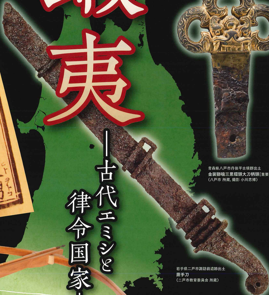
岩手県二戸市諏訪前遺跡出土 藤手刀 (二戸市教育委員会 所蔵)