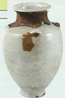
岩手県平泉町 柳之御所遺跡出土 白磁四耳壺[重要文化財] (岩手県教育委員会 所蔵)