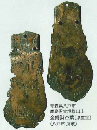
青森県八戸市 鹿島沢古墳群出土 金銅製杏葉(県重宝) (八戸市 所蔵)