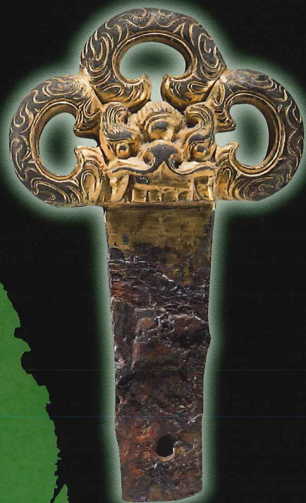
青森県八戸市月後平古墳群出土 金装獅喙三累環頭大刀柄頭【重要文化財】 (八戸市 所蔵)