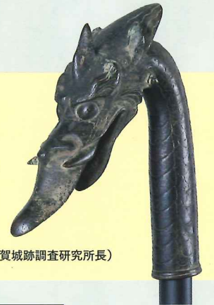
岩手県北上市 極楽寺伝世 銅電頭[重要文化財] (極楽寺 所蔵)