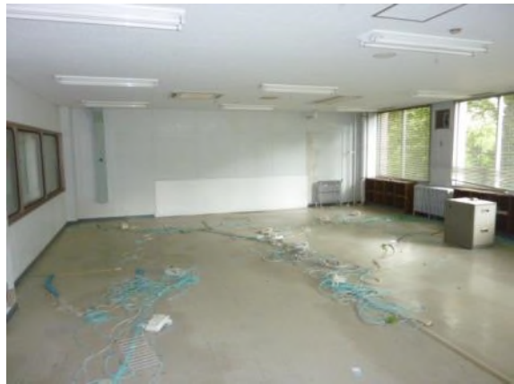
③ 宿泊棟 (RC 3階 延床面積 874 m 2 昭和 48 年 3 月完成)