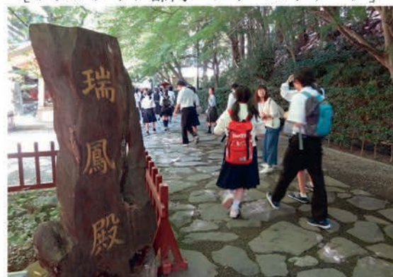
[文芸部門 文学研修]