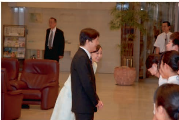
[総合開会式 出演者によるお見送り]