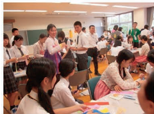
[梅香女子情報高等学校・富谷高等学校]