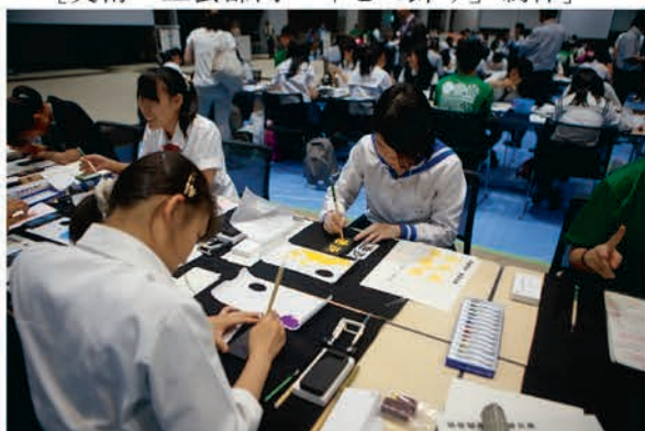
[書道部門 記念品（硯石）作成]