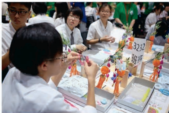
[美術・工芸部門 「七つ飾り」制作]

[書道部門] 交流会で震災のがれきの中から発見された硯を利用して揮毫した紙を貼り合わせた吹き流しの作成と震災の津波で被災した雄勝の硯石に絵の具で文字を書いた記念品の交換