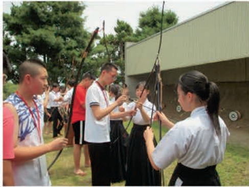
[浄月実験学校・築館高等学校]