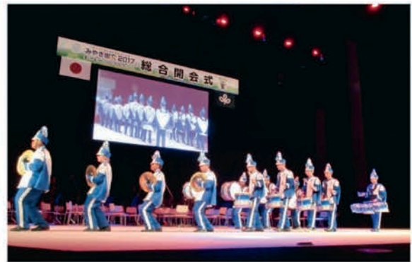
[ドーバー高等学校]