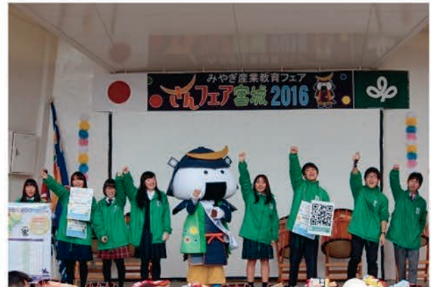
[みやぎ産業教育フェアでの大会PR]