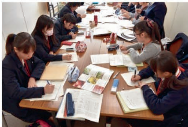
[生徒企画委員会（総務委員会）]