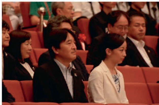
[器楽・管弦楽部門御覧]