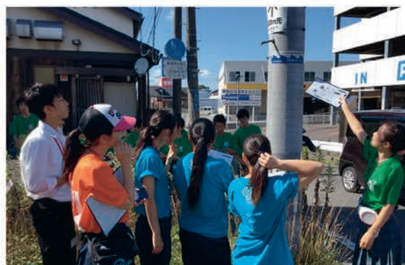
[ボランティア部門 フィールドワーク]