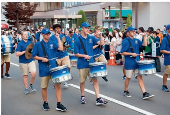
[ドーバー高等学校]