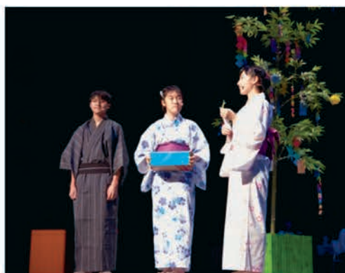
[オープニングアクト]