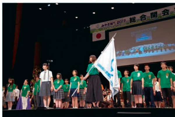
[全国高文連旗の引継ぎ]