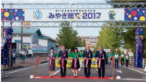
[出発式・テープカット]