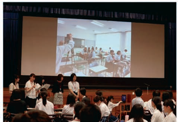
[生徒実行委員統括会議]