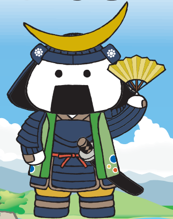
大会マスコットキャラクター むすび丸