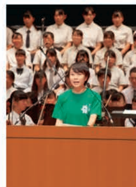
[生徒代表歓迎のことば]