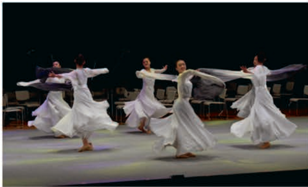
[東北師範大学附属中学浄月実験学校]