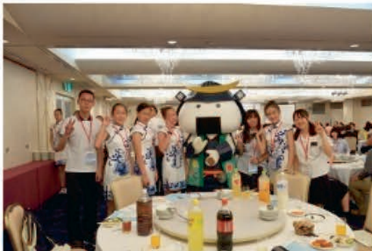
[歓迎レセプション]