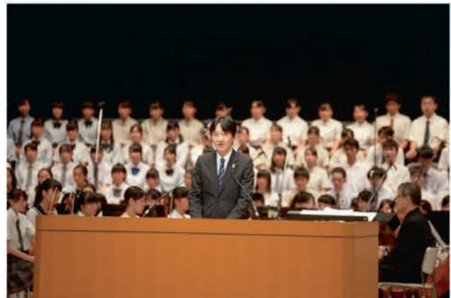
[総合開会式 秋篠宮殿下のおことば]