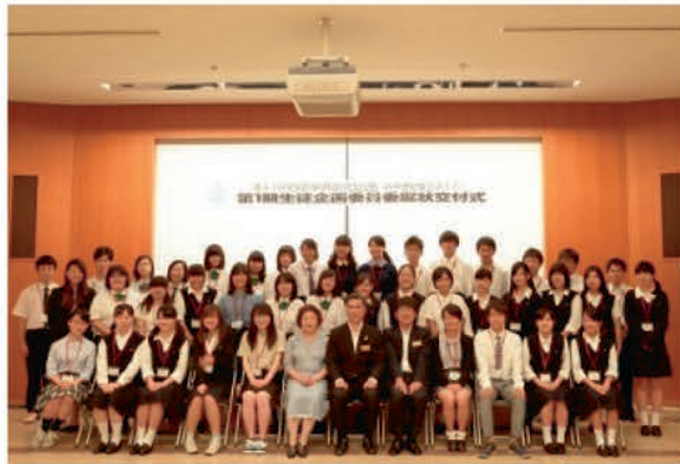
[生徒企画委員委嘱状交付式]

また、開催する23部門においても部門生徒実行委員会を組織し、各部門大会の企画・運営を行いました。