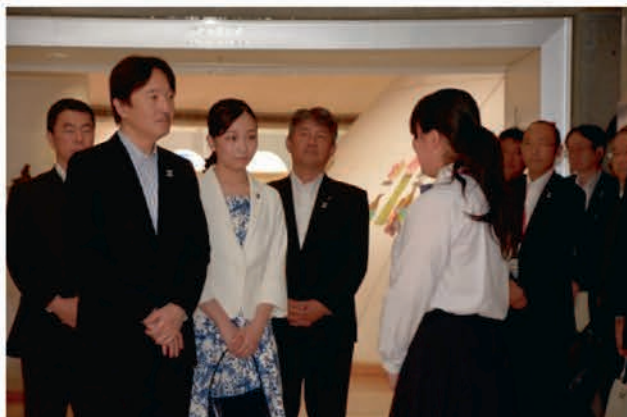
[ボランティア部門御覧]

午前、東北歴史博物館でボランティア部門を御覧いただいたあと、岩沼市民会館で器楽・管弦楽部門の演奏を御覧いただき、帰京されました。