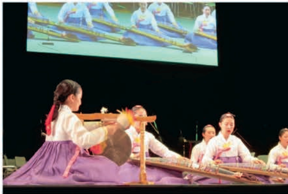
[梅香女子情報高等学校]