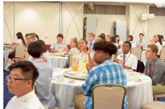
[歓迎レセプション]