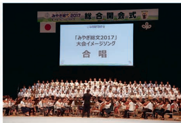
[大会イメージソング合唱]