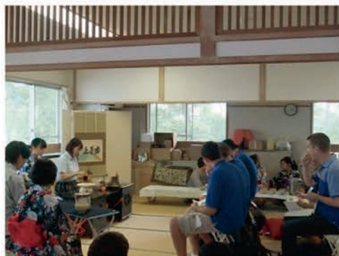
[ドーバー高等学校・角田高等学校]