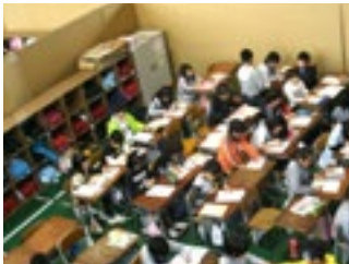
震災後の体育館での授業

今年は念願だった新校舎が完成し、校庭も5年ぶりに全面使用できるようになりました。今、子どもたちは、毎日生き生きとした表情で学校生活を送っています。多くの困難を経験した子どもたちですから、通常の学校生活を送ることができることに感謝し、日々を過ごしています。