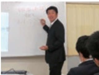
仮設校舎での授業

沢山の生徒が様々な場所で活躍している結果が現れているからです。環境が整わない時だからこそ先生方が生徒たちにきっかけを与え、生徒たちが自ら考え外部に向けて働きかけた結果なのです。教育現場における復興とは何か。それは徹して教え、徹して学ぶ。環境ではなく、思いではないでしょうか。今教師を目指す方々も何かしらの思いを持って教師を目指していると思います。その強い思いを持った皆さんと共に働ける日を楽しみにしています。