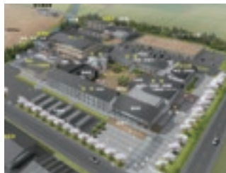
新校舎イメージ図