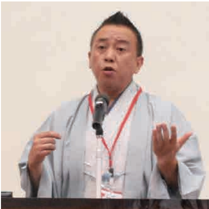
林家 たい平氏 落語家/みやぎ絆大使

林家たい平氏からは、人と人の「縁」を軸にお話をいただきました。中学時代に教師に憧れ、当時の先生から美術教師を勧められて美術の道に進んだお話や、なぜ落語の道に進んだのか、落語家を目指す最中や落語家として出会った人々とのお話がありました。それらを通して「縁に偶然はなく必然の縁である。どんな縁も自分にとっては大切な縁であり、出会いや縁を大切にすることで、人生が変わる」とメッセージをいただきました。