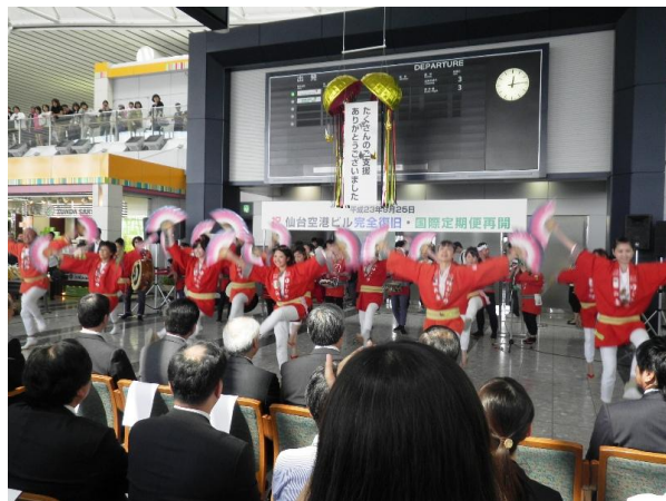
▲9/25 仙台空港ビル完全復旧・国際定期便再開記念式典 (雀踊り)

セレモニーには前田国土交通大臣をはじめ、東日本大震災復興対策本部宮城現地対策本部の郡本部長、村井知事などが出席し、空港ビルの完全復旧と国際定期便の再開をお祝いしました。