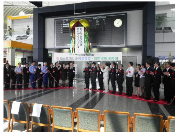
▲9/25 仙台空港ビル完全復旧・国際定期便再開記念式典

仙台空港は東日本大震災により甚大な被害を受けましたが、多くの方々の御尽力及び御支援のもと復旧作業が進み、7 月 25 日に国内定期便が再開され、9 月 25 日にターミナルビルが完全復旧するとともに、国際定期便が再開されました。