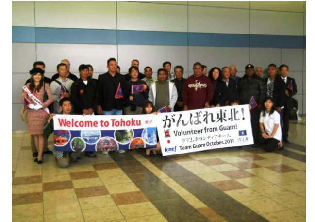
▲10/2 グアムからの東北被災地支援ボランティアツアーの方々

震災により運休しておりましたユナイテッド航空(コンチネンタル航空)による仙台ーグアム線が、7 月からの臨時便の運航を経て、10 月 2 日より定期便の運航が再開しました。その初便を利用して、東北の被災地へのボランティアツアーの方々がグアムより到着され、2011 せんだい・杜の都親善大使と仙台空港国際化利用促進協議会の関係者が歓迎のお出迎えをしました。