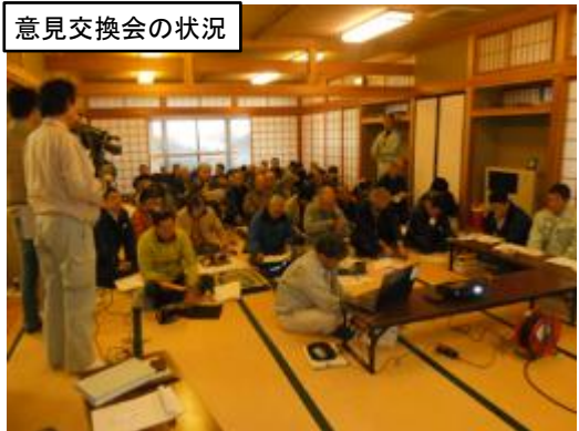
意見交換会の状況