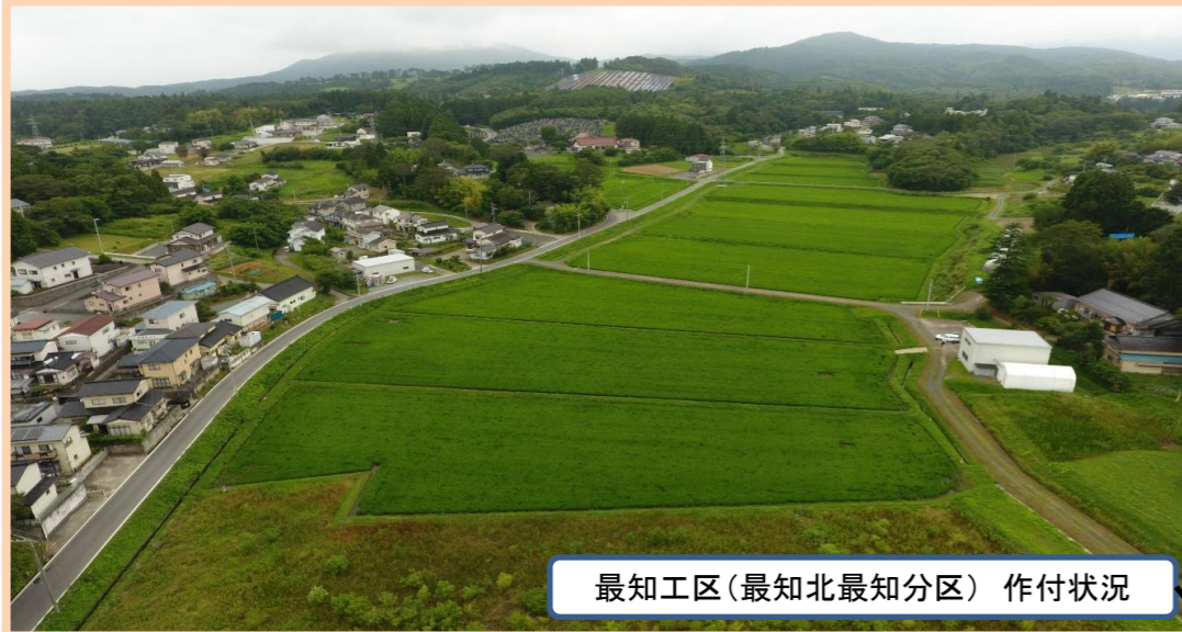
最知工区(最知北最知分区) 作付状況