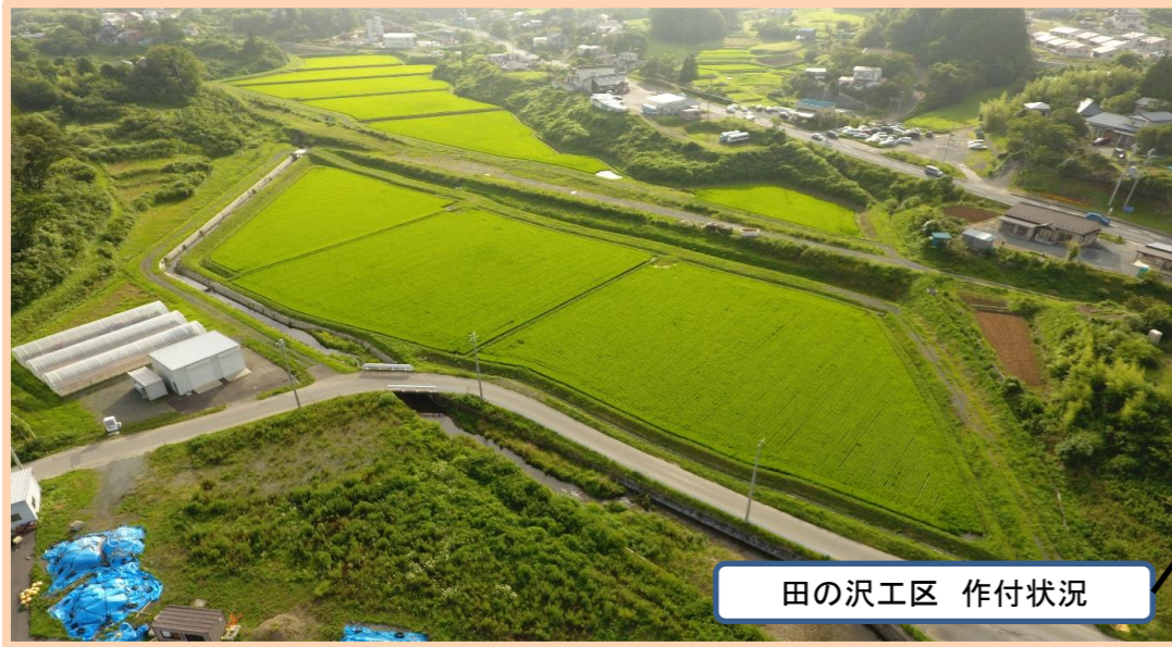
田の沢工区 作付状況