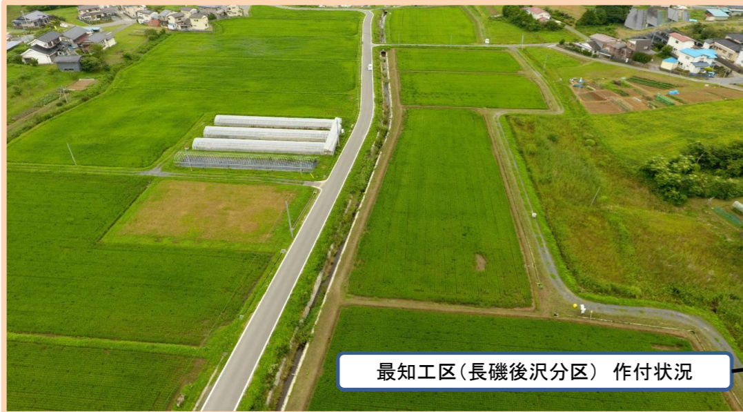
最知工区(長磯後沢分区) 作付状況