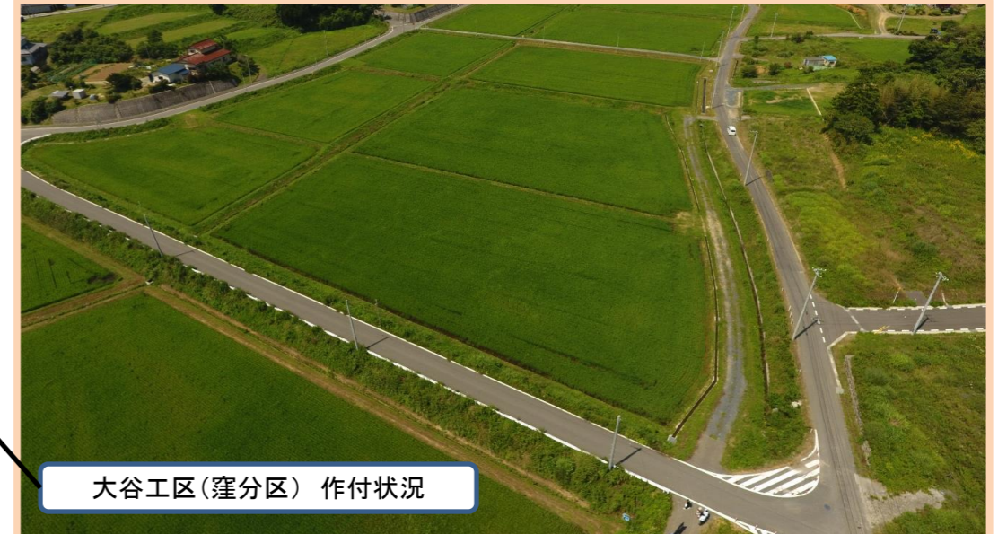
大谷工区(窪分区) 作付状況