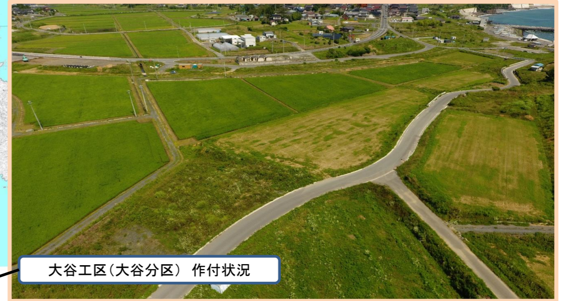
大谷工区(大谷分区) 作付状況