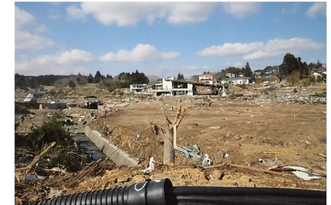
▲ 被災状況（大谷工区）