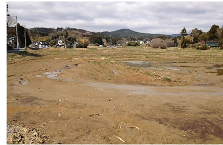
▲ 被災状況（最知工区）