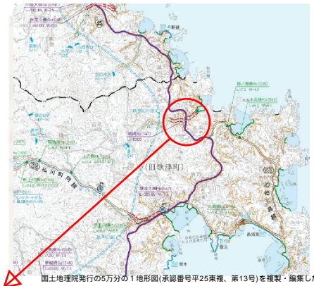
港川 位置図 (南三陸町)

国土地理院発行の5万分の1地形図(承認番号平25東環、第13号)を複製・編集したものである。