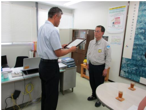
スマイルサポーター認定証交付の様子

このたび、大成・丸か・栄喜建設工事共同企業体をスマイルリバーサポーターとして認定し、8月4日（火）に認定証交付式を行いました。今回の認定により、気仙沼土木事務所管内のスマイルサポーターとしては36団体目、またスマイルリバーサポーターとしては6団体目の認定となりました。