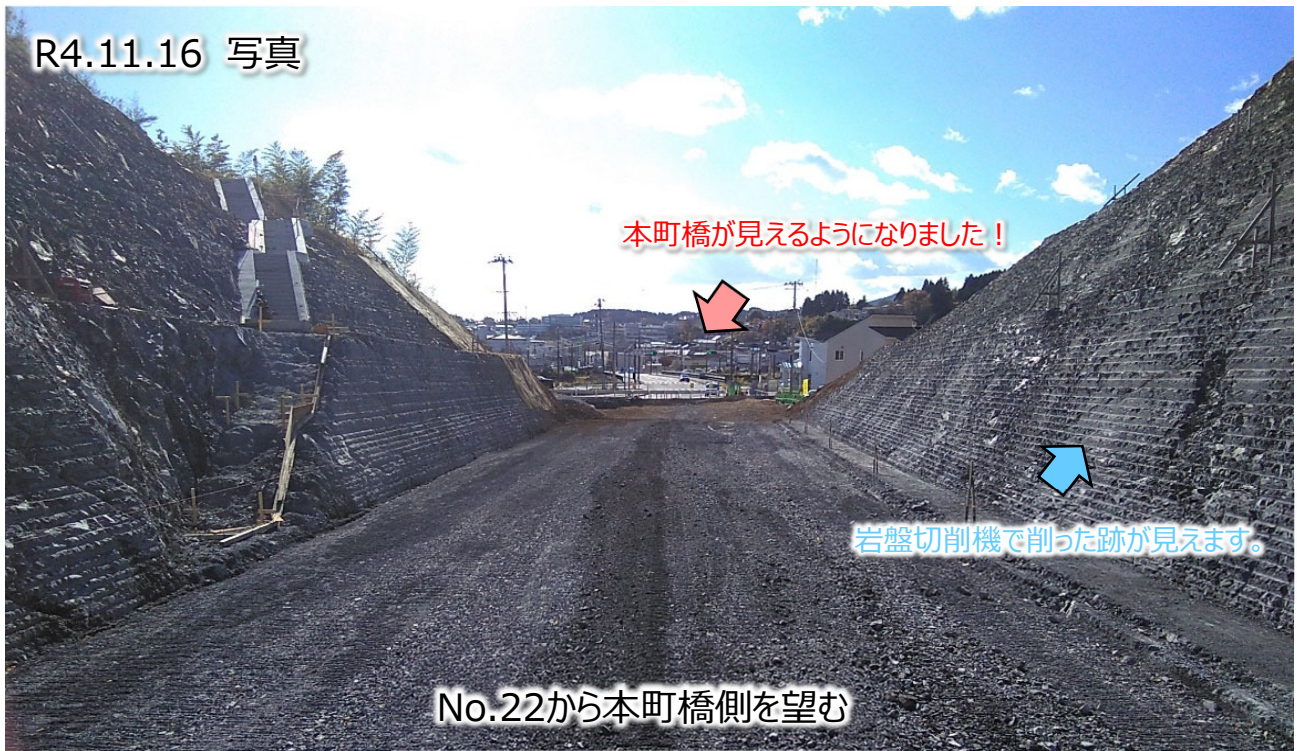
No.22から本町橋側を望む