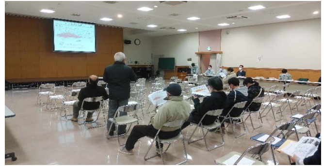
工事説明会の様子(ワンテンビル大会議室)

今回の工事は、現道の幅員が狭く急勾配区間の解消を目的として、本町橋から約320m（平面図のNo.16～32）区間を掘削し、No.30付近の工事現場事務所入り口辺りから現況にすり付けを行う道路改良工事です。