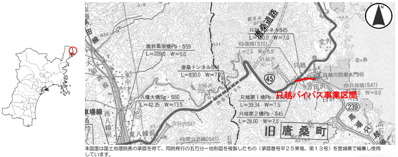
本図面は国土地理院長の承認を得て、同院発行の五万分一地形図を複製したもの(承認番号平25東榎、第13号)を宮城県で編集し使用しています。