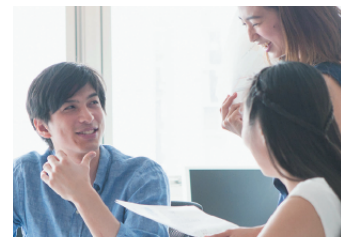
4 学生交流 ネットワーク