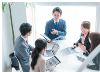
2 宮城県中小企業DX化 推進ネットワーク