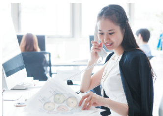
1 女性活躍推進 ネットワーク