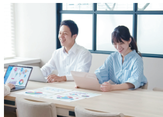
3 気仙沼人財活躍 推進ネットワーク