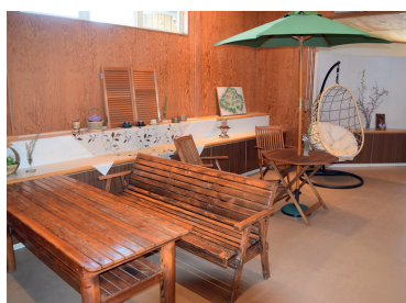
管理棟内もおしゃれな雰囲気

「おしゃれで自慢したくなるふるさと」をコンセプトに整備された施設内には、多彩なタイプのログハウスが立ち並び、各棟にはキッチン、浴室などを完備しているほか、中庭を利用してバーベキューを楽しむ