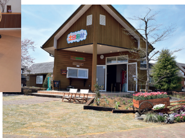
木の香りが漂う本格的なログハウス