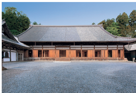
平成の大修理を終えた国宝瑞巖寺