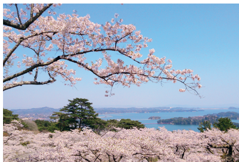
松島湾は四季折々の表情も楽しめます