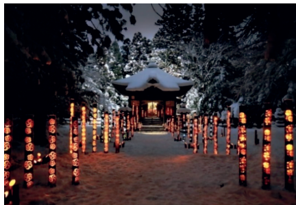
夜の町を彩る「竹灯籠」／福島県柳津町