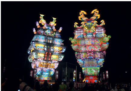
能代七夕「天空の不夜城」／秋田県能代市

ロゴマークは、東北6県の「六」をモチーフに、旅する人間の姿をアイコン化。背景の日の丸とともに躍動的な東北の旅を表現しています。