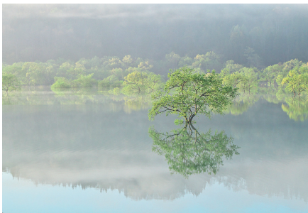
湖に出現する春の絶景「水没林」／山形県飯豊町・長井市