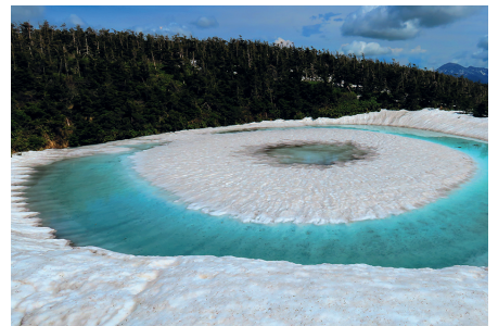
八幡平ドラゴンアイ／岩手県八幡平市