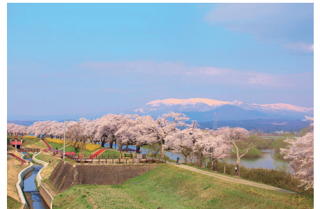
白石川堤一目千本桜／宮城県大河原町・柴田町