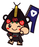
町観光PRキャラクター 「わたりん」