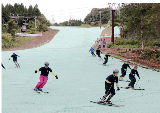
冬とは違う爽快感を味わえます♪

県内唯一のサマーゲレンデ セントメリースキー場は仙台市から40分、山形市から25分、町から「すぐそこ」で有名なスキー場。特に全長640㍎・最大斜度17度のサマーゲレンデは東北最大! 県内唯一・夏でも雪の上を滑っているような感覚です。 本格的な冬のシーズンに備えて技術の向上を目指す若者たちのメッカとして定着しています。