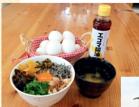
えごまたまごかけごはん、480円。 種類豊富なトッピングも楽しい。