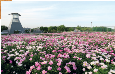
見事に咲くシャクヤクをバックに写真撮影をどうぞ。