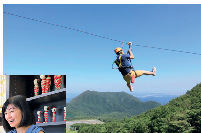
ZIPラインアドベンチャー

自分にぴったりのプログラムを見つけて、今まで知らなかった新たな仙台の魅力を体感してみませんか。