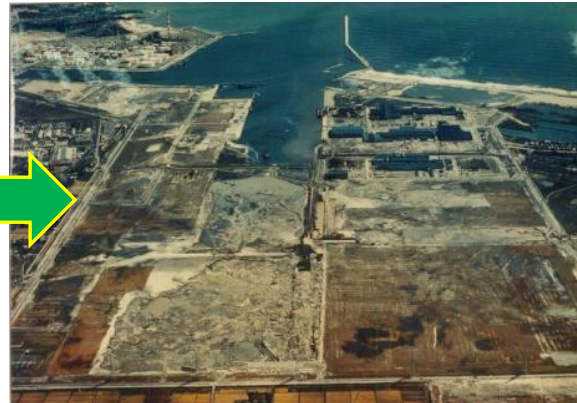
建設途中の仙台港(昭和49年)