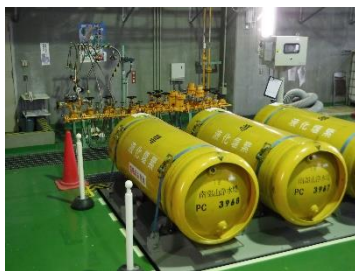
<塩素を注入するための設備>