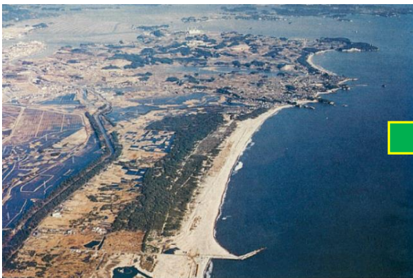
仙台港築港前の仙台湾地区のようす(昭和43年)