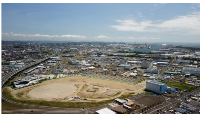
今も発展を続ける仙台港周辺地域

地域整備事業については、ご紹介した仙台港周辺地域における事業を着実に取り組むことで、今後もより一層地域の発展の一助となるよう努めていくほか、地方公営企業として県民ニーズに的確に応え、絶えず住民福祉の向上を目指すという観点から、新分野における事業の可能性について、情報収集や関係機関との連携を積極的に推進してまいります。