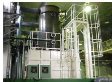
<漏洩した塩素を中和させる設備>