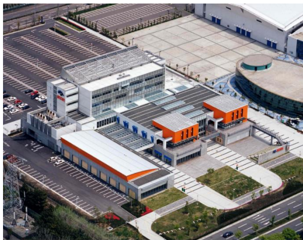
仙台港国際ビジネスサポートセンター（アクセル）全景

仙台港は昭和60年当時、東北地方の拠点的な流通港としての機能を果たすようになっていましたが、外国貨物コンテナの多くは京浜地区を経由しており、更なる国際化による取扱数の増進が求められて