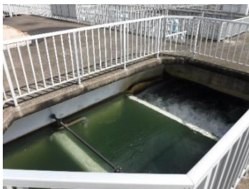
<1次混和池：PAC・塩素を注入します>

訓練では、塩素の一般的な特徴や塩素漏洩時の対処方法、漏洩時に使用する機器やライフゼム（空気呼吸器及び防護服）の使用方法などを、講義で学ぶとともに実地演習を実施しています。安心して飲める水道水には、塩素は欠かすことのできない物質であるため、塩素漏洩時には浄水場の職員のみならず、外部の住民の方にも影響を及ぼすことから、安心で安定的な水道水の供給に万全を期してまいります。