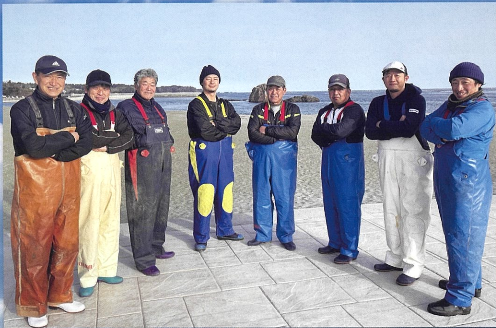
「あまころ牡蠣」生産グループ