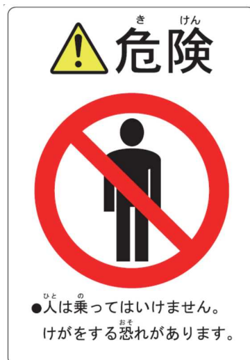
「搭乗禁止」ステッカーの例