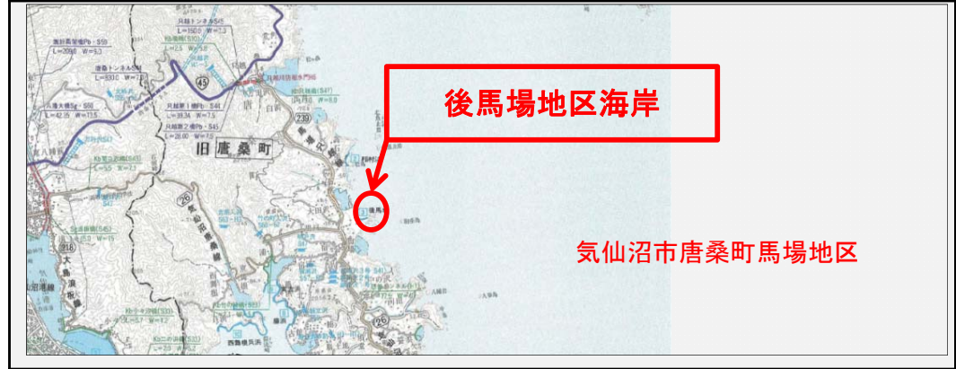
① 着手前 平成26年7月