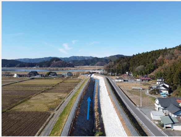
①令和3年11月末現在の状況