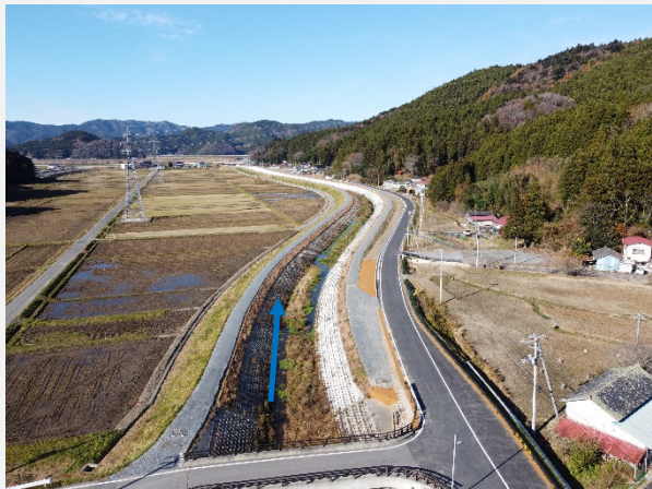
③令和3年11月末現在の状況