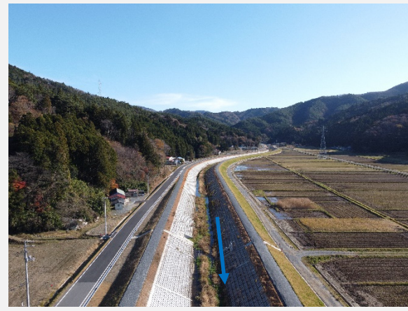
②令和3年11月末現在の状況