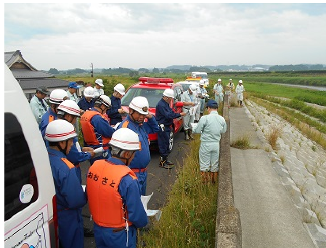
吉田川危険箇所の巡視