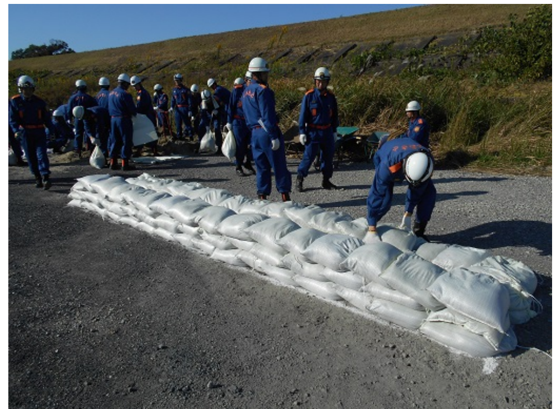
積土のう工法訓練