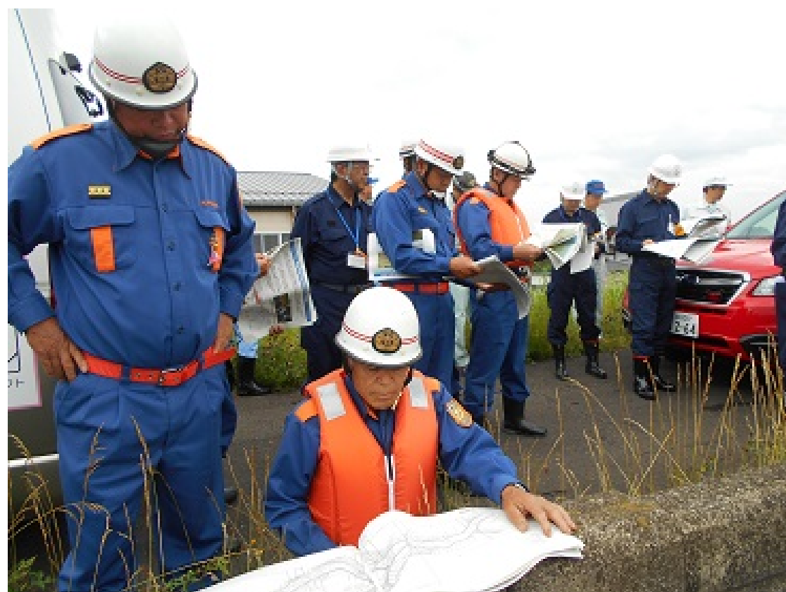
吉田川危険箇所の巡視