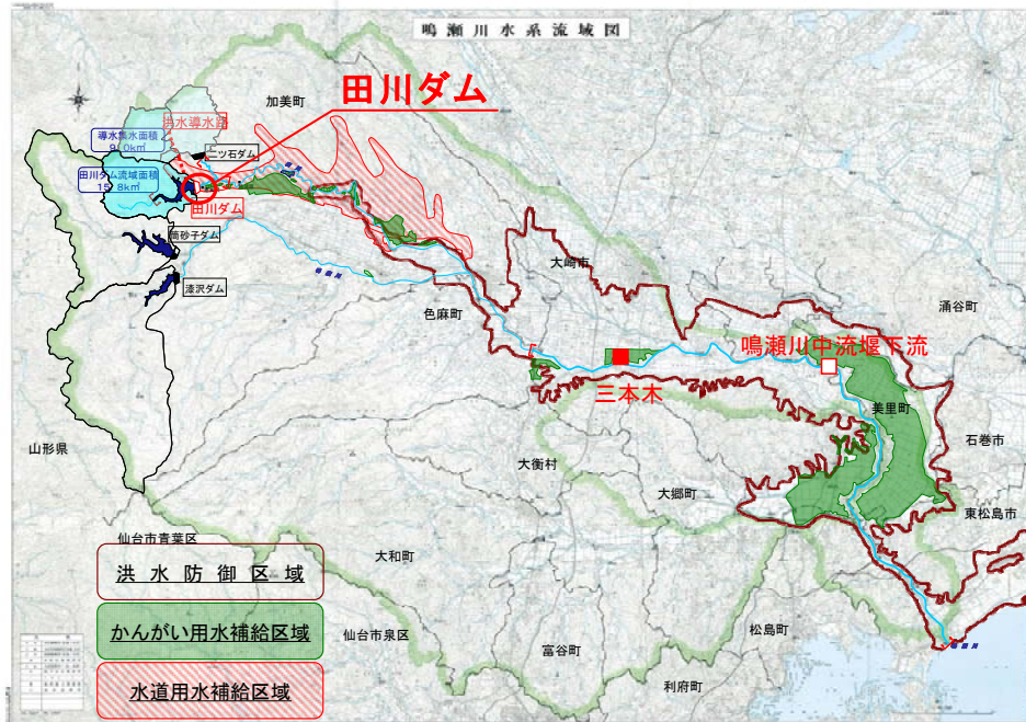
図 3-1 田川ダム計画概要図

田川ダムは、鳴瀬川水系支川田川の上流の宮城県加美郡加美町において実施計画調査中の多目的ダムで、洪水調節、流水の正常な機能の維持、かんがい用水の補給、水道用水の供給を目的としている。