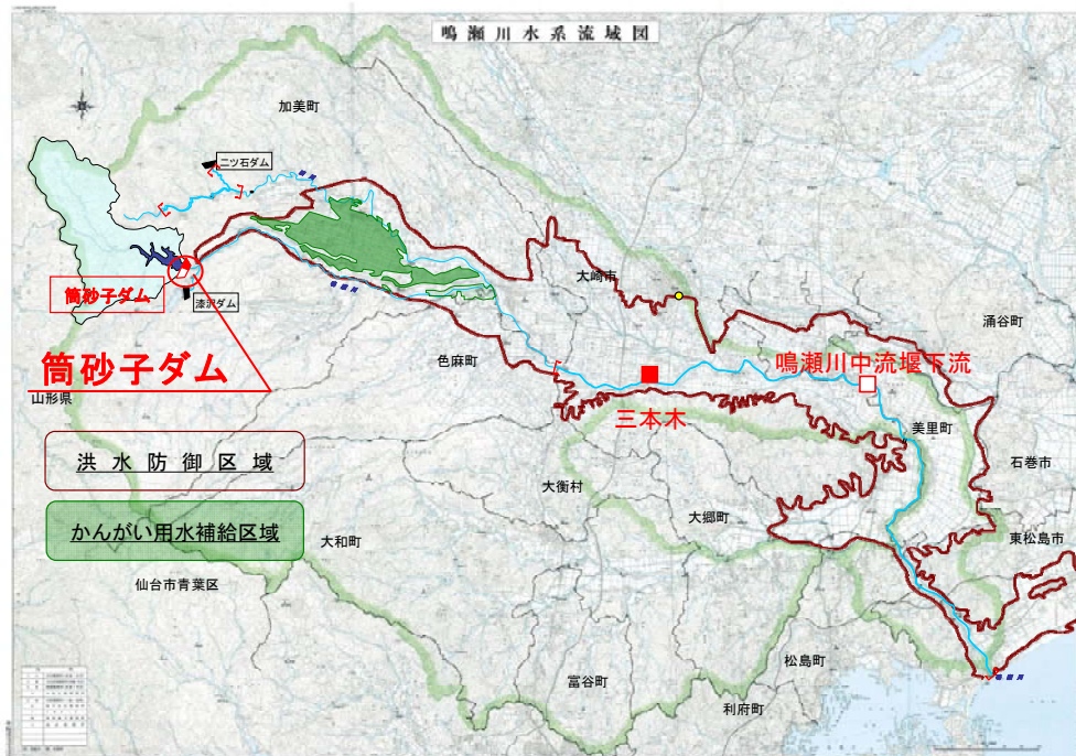
図 3-3 筒砂子ダム計画概要図

筒砂子ダムは、鳴瀬川水系支川筒砂子川の上流の宮城県加美郡加美町において建設中の多目的ダムで、洪水調節、流水の正常な機能の維持、かんがい用水の補給を目的としている。