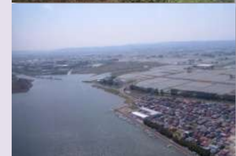
広浦の状況(震災前)