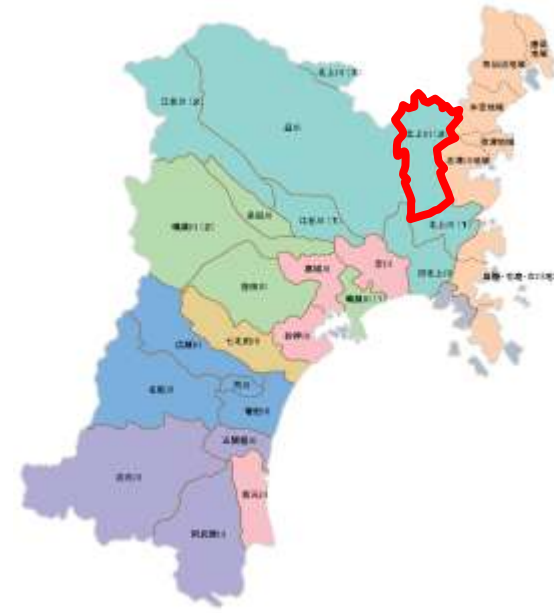
宮城県全体位置図