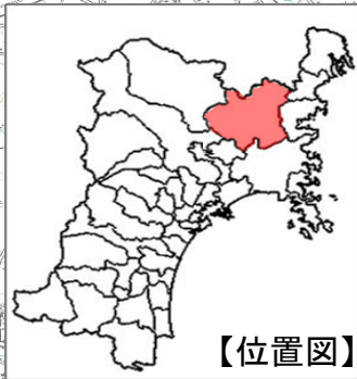
宮城県東部土木事務所登米地域事務所管内図