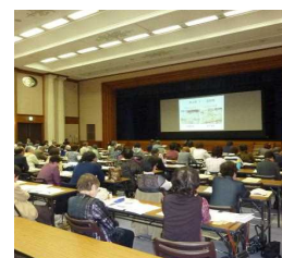
ウォッチャー業務説明会

食品表示ウォッチャーとして、食の安全安心消費者モニターから100人を委嘱し、食品表示に係る知識の習得を図るとともに、食品販売店における食品表示モニタリング調査（平成24年6月から24年12月、毎月2店舗、各5品目）を実施し、その報告を受け、国及び市町村と連携して、調査・指導を実施した。