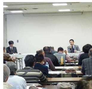
消費者モニター研修会