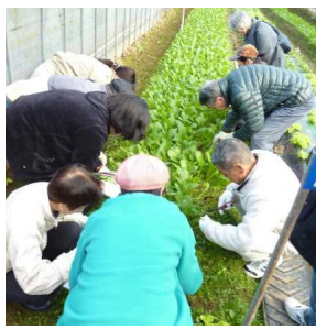
生産者との交流会