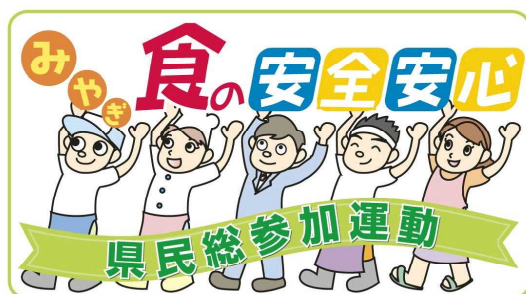
●「みやぎ食の安全安心県民総参加運動」ロゴマーク