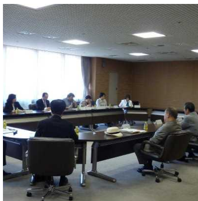
第1回みやぎ食の安全安心推進会議